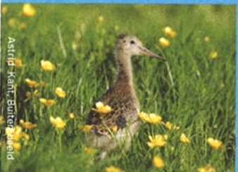
Astrif - Kent, Buiten-beeld