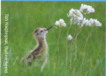
Ton Nagtegaal, Buiten-beeld