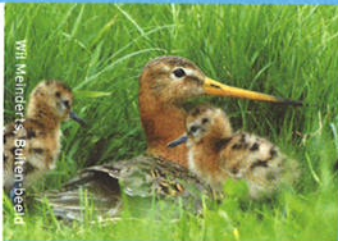
Van Meenderst, Buiten-beeld