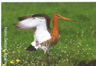
Hans Gebuis / Agami

De grutto maakt zijn nest liefst in kruidenrijk en bloemrijk grasland met een hoge grondwaterstand. Hij probeert het altijd eerst op de piek waar hij eerder succesvol heeft gebroed. Als dat niet lukt, zoekt hij (binnen een straal van 2 km) een plek waar al soortgenoten broeden.