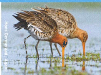
Hans Gerritsen / Agami

Na aankomst moeten grutto's eerst opvetten op vochtige plekken, waar de wormen niet te diep zitten. Liefst vochtig grasland met plasdras, en anders open wetlands in de buurt. Tot ongeveer een week voor de eierleg slapen ze in een plas-dras of wetland.